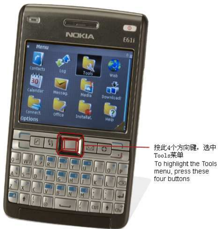
圖 4 (1)

4. 如圖 4(1)用流覽鍵選中 Tools, 然後如圖 4(2)進入 Tools 功能表